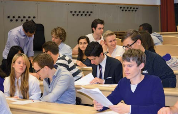
Etudiants lors de l'atelier d'I&C «Are you pulling on the same rope?».